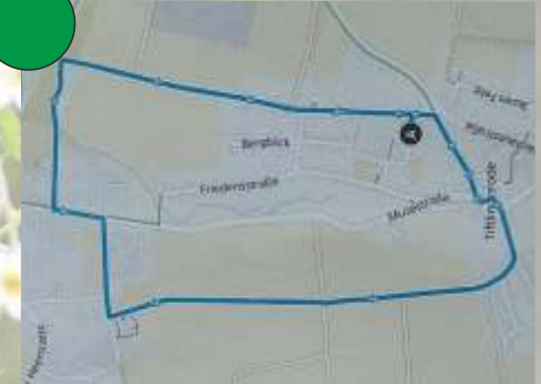
Grüne Strecke: Kinderwagenstrecke ca 3 km (Märchenstrecke)